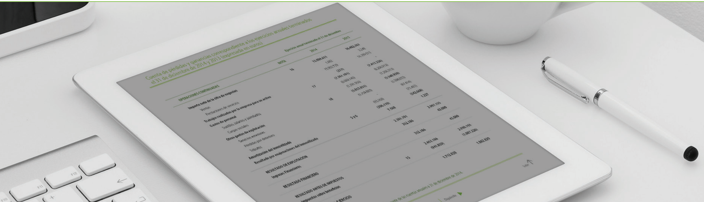
Cuenta de pérdidas y ganancias correspondiente a los ejercicios anuales terminados el 31 de diciembre de 2014 y 2013 (expresada en euros)